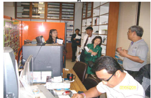
คณะกรรมการประเมินฯ เยี่ยมชมฝ่ายพัฒนาสื่อการส่งเสริม วันที่ 7 กรกฎาคม 2554