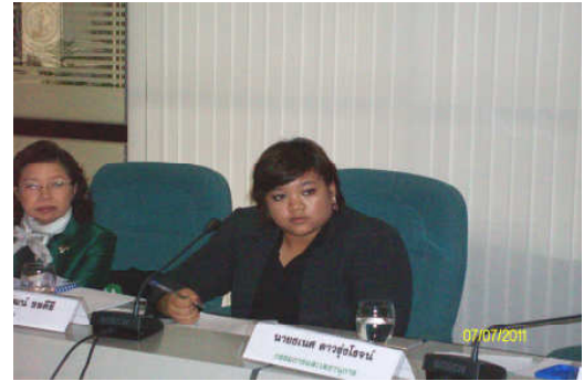
คณะกรรมการประเมินฯ พบผู้บริหารหน่วยงาน วันที่ 7 กรกฎาคม 2554