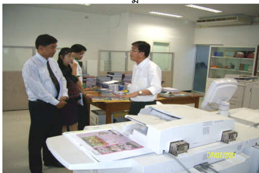
คณะกรรมการประเมินฯ เยี่ยมชมฝ่ายโรงพิมพ์ วันที่ 7 กรกฎาคม 2554