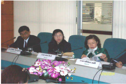
คณะกรรมการประเมินฯ พบผู้บริหารหน่วยงาน วันที่ 7 กรกฎาคม 2554