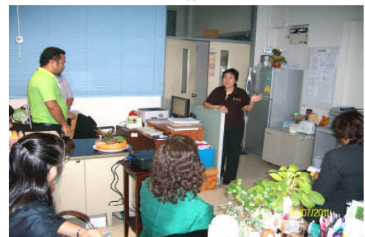
คณะกรรมการประเมินฯ เยี่ยมชมฝ่ายฝึกอบรม วันที่ 7 กรกฎาคม 2554