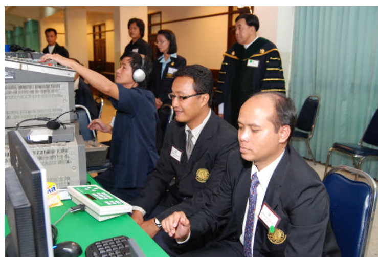
ภาพที่ 1.1 การให้บริการวิชาการ ประจำปีงบประมาณ 2553 (ปัจจุบัน) สำนักส่งเสริมและฝึกอบรม มหาวิทยาลัยเกษตรศาสตร์