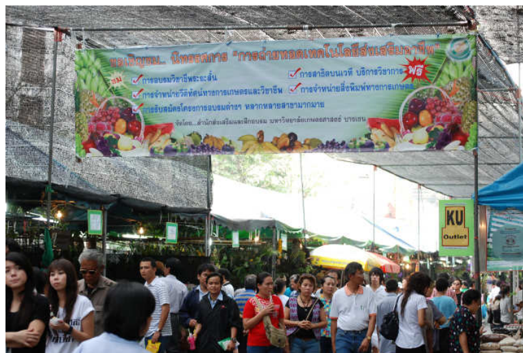
ภาพที่ 1.2 การให้บริการวิชาการแก่สังคม ประจำปีงบประมาณ 2553 (ปัจจุบัน) สำนักส่งเสริมและฝึกอบรม มหาวิทยาลัยเกษตรศาสตร์