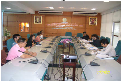
คณะกรรมการประเมินฯ สัมภาษณ์ผู้รับบริการ วันที่ 7 กรกฎาคม 2554