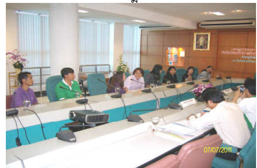
คณะกรรมการประเมินฯ สัมภาษณ์ผู้บุคลากร วันที่ 7 กรกฎาคม 2554