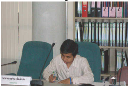
คณะกรรมการประเมินฯ ตรวจสอบเอกสารหลักฐาน วันที่ 7 กรกฎาคม 2554