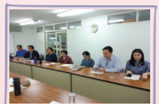
ภาพการลงพื้นที่คณะวิชาเพื่อให้ข้อมูลป้อนกลับ (feedback) ผลการดำเนินงาน ปีการศึกษา 2560