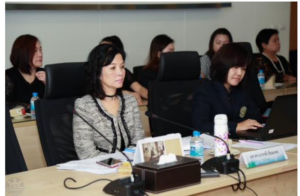
คณะกรรมการประเมินฯ สัมภาษณ์ทีมผู้บริหารคณะบริหารธุรกิจ