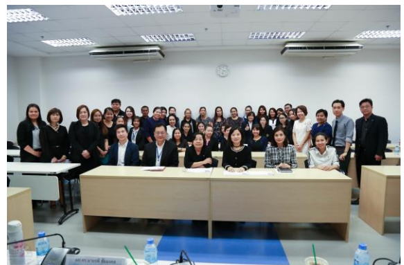
คณะกรรมการประเมินฯ รายงานผลการประเมินต่อผู้บริหาร และบุคลากรคณะบริหารธุรกิจ