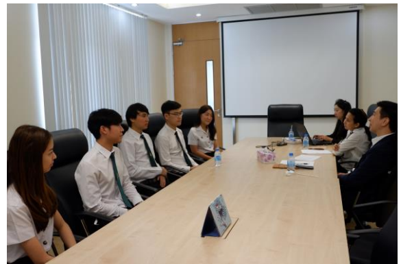
คณะกรรมการประเมินฯ สัมภาษณ์กลุ่มผู้ใช้บัณฑิต ศิษย์เก่า และนิสิต