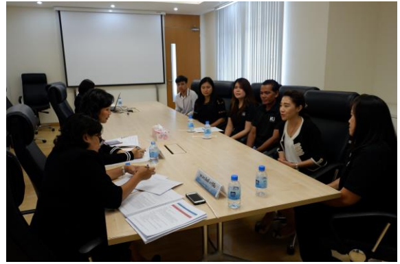
คณะกรรมการประเมินฯ สัมภาษณ์กลุ่มอาจารย์ และบุคลากร