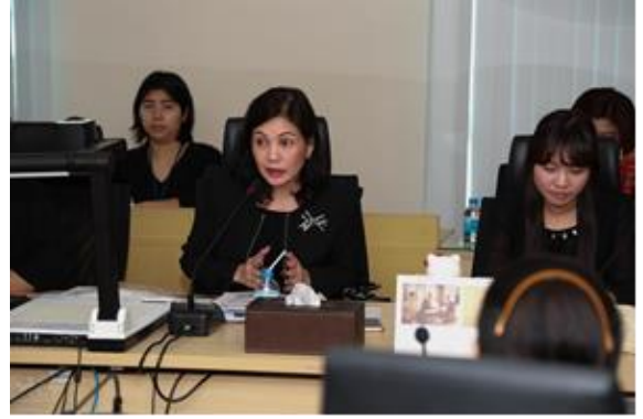
ผู้บริหารคณะบริหารธุรกิจ รายงานผลการดำเนินงานในรอบปีการศึกษา 2559