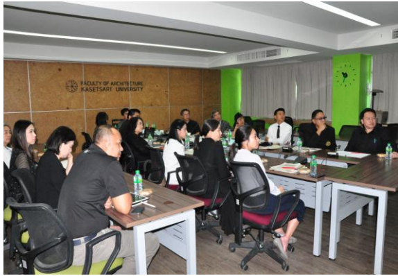
ผู้บริหารพบคณะกรรมการและรายงานผลการดำเนินงาน