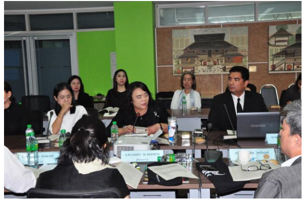
คณะกรรมการสัมภาษณ์บุคลากรและนิสิต