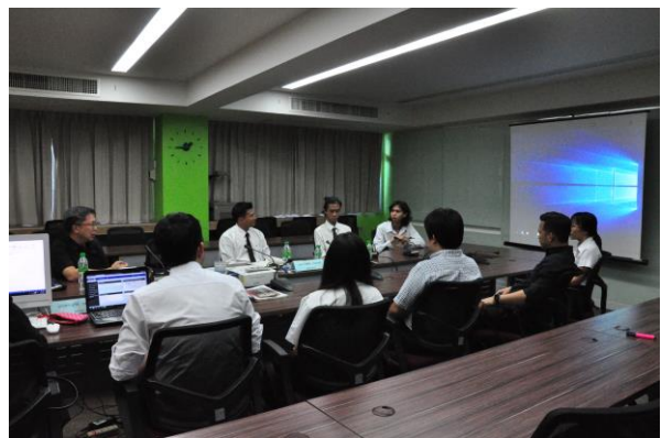
คณะกรรมการสรุปผลการประเมินและนำเสนอ