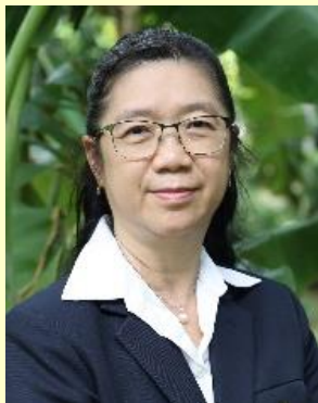
กรรมการและ เลขานุการ

การเงิน การธนาคาร การวิเคราะห์ การลงทุน ธรรมาภิบาล