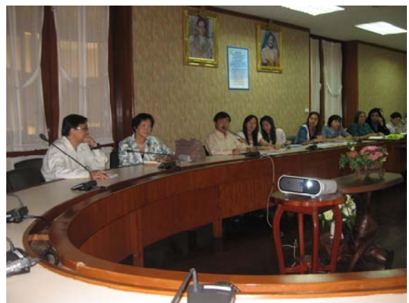
คณะกรรมการประเมินฯ รายงานผลการประเมินฯ วันที่ 3 กรกฎาคม 2556