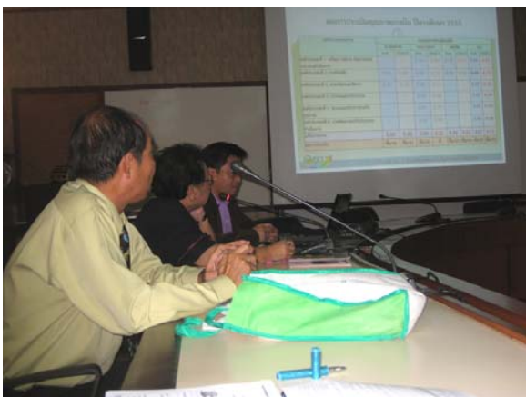
คณะกรรมการประเมินฯ รายงานการผลประเมินฯ วันที่ 3 กรกฎาคม 2556