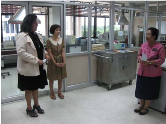
คณะกรรมการประเมินฯ เยี่ยมชมหน่วยงานภายใน วันที่ 2 กรกฎาคม 2556