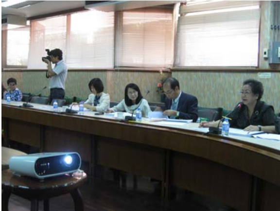
คณะกรรมการประเมินฯ พบผู้บริหารหน่วยงาน วันที่ 1 กรกฎาคม 2556