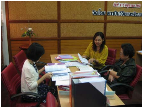
คณะกรรมการประเมินฯ ตรวจสอบเอกสารหลักฐาน วันที่ 1 กรกฎาคม 2556