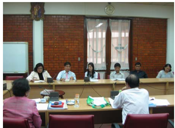
คณะกรรมการประเมินฯ สัมภาษณ์บุคลากร วันที่ 2 กรกฎาคม 2556