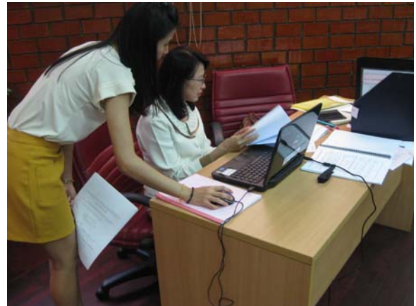
คณะกรรมการประเมินฯ ตรวจสอบเอกสารหลักฐาน วันที่ 1 กรกฎาคม 2556