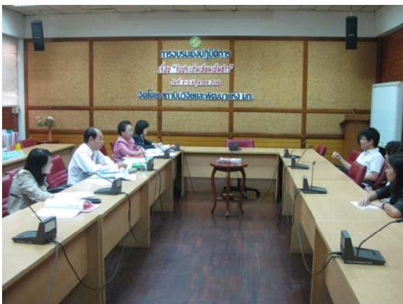
คณะกรรมการประเมินฯ สัมภาษณ์ผู้ใช้บริการ วันที่ 2 กรกฎาคม 2556