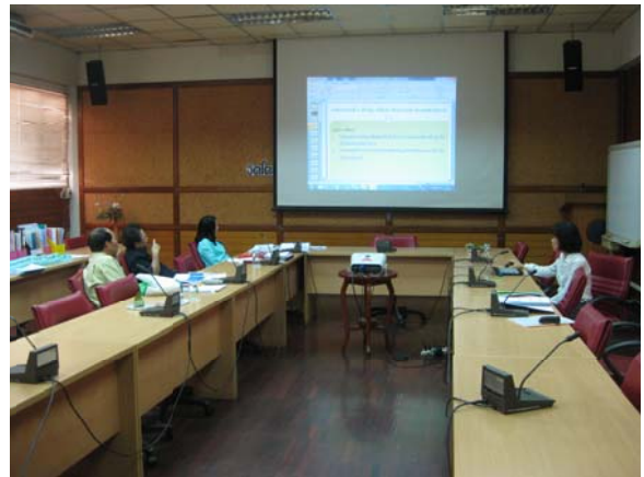
คณะกรรมการประเมินฯ สรุปผลการประเมินฯ วันที่ 3 กรกฎาคม 2556