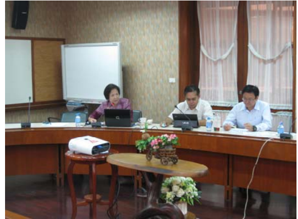
ผู้บริหารหน่วยงานรายงานผลการดำเนินงาน วันที่ 1 กรกฎาคม 2556