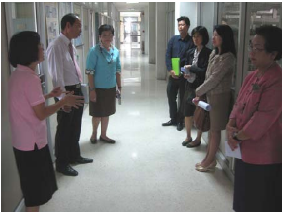
คณะกรรมการประเมินฯ เยี่ยมชมหน่วยงานภายใน วันที่ 2 กรกฎาคม 2556