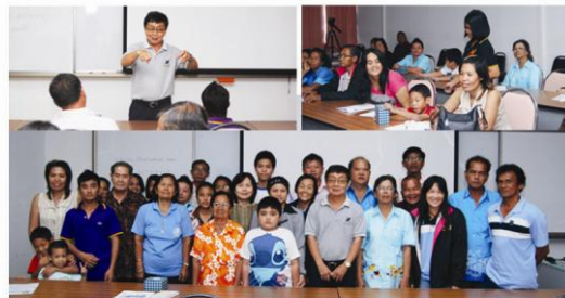
โครงการบริการวิชาการแก่ชุมชน เรื่อง การเพาะเลี้ยงไส้เดือนและแมลงกลบ