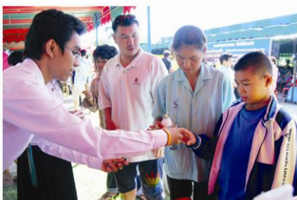
โครงการบริการวิชาการแก่ชุมชน สานสายใยสู่ชุมชน