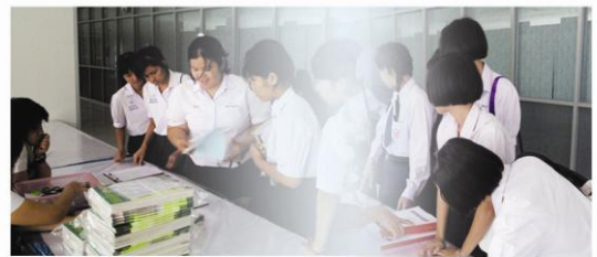
โครงการส่งเสริมความสามารถพิเศษภาคฤดูร้อน ประจำปี 2554