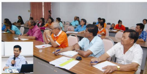
โครงการบริการวิชาการ เรื่อง การกำจัดศัตรูพืช