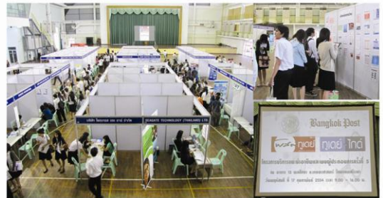
โครงการบริการแนะนำอาชีพและพบผู้ประกอบการ