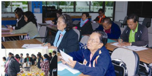
โครงการบริการวิชาการ เรื่อง การเพาะเลี้ยงหอยแมลงภู