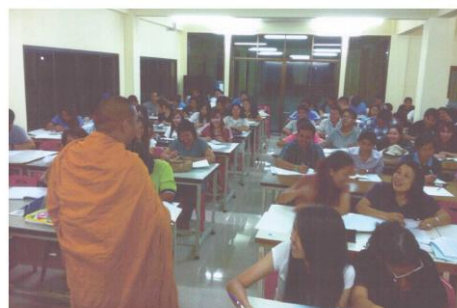
โครงการบริการวิชาการชุมชน การพัฒนาการเรียนการสอนของชุมชนศรีราชา