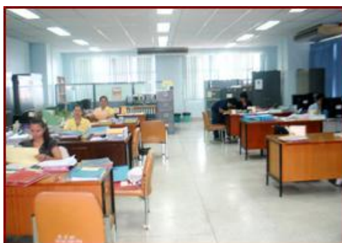
ลักษณะทางกายภาพของสำนักงานวิทยาเขต