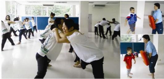
โครงการบริการวิชาการส่งเสริมสุขภาพเยาวชนกับกีฬาเทควันโด